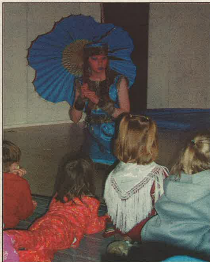
Jiehtanasa nieida jur gehččiid ooddabealde.