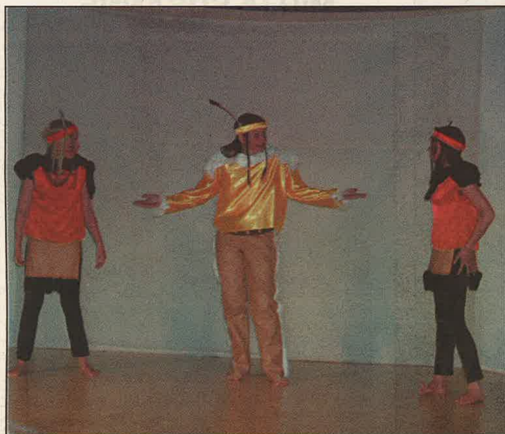
Beivvi bárdni ja su olbmát vuolgime eamida gávdnat Beivvi bárdnái.

Guovdageaidnu: Gállánuoraid Teáhter lea nuoraidteáhter mii álggahuvvui Guovdageainnus diibmá. Miessemánu 17. b. lei sis vuosttaš čájálmas bihtas «Gállábártnit».