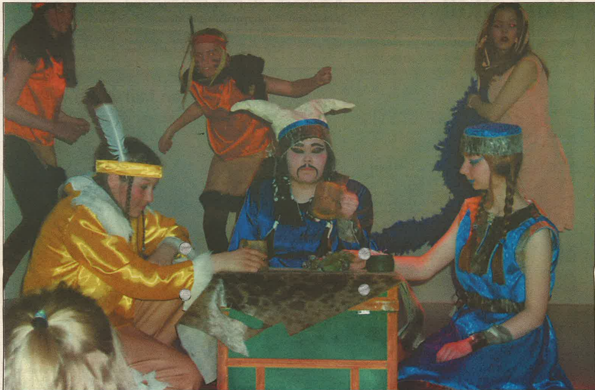
Beivvi bárdni, Jiehtanas ja jiehtanasa nieida boradit headjamállasiid. Beivvi bárdni lea juste náitalan jiehtanasa nieiddain.