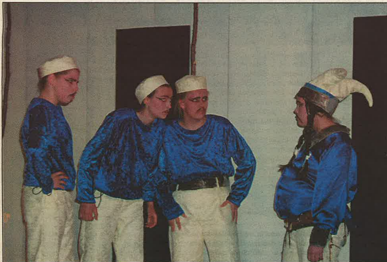
Jiehtanas ja su golbma bárdni. Sii gal eai liikon go áhččiset ges oabbáset náittii eret.